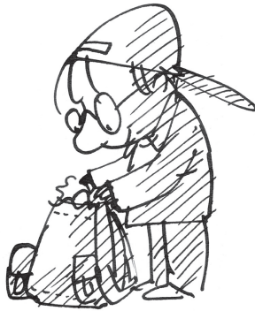
ILUSTRACIÓN EMILIO URBERUAGA