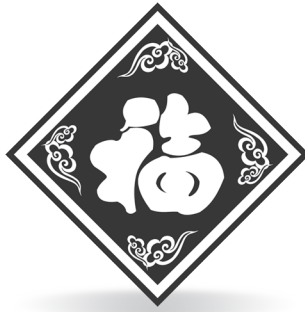
Símbolo del Fo o Fu

Es característico encender juegos pirotécnicos para alejar los problemas y la mala energía durante el año; también colocan dentro de la casa, arriba de la puerta principal, imitaciones de cohetes con caracteres chinos de suerte y fortuna que se pueden hacer con sobres rojos, como se mencionó con anterioridad. También se pueden colocar cinco de estos sobres sobre el marco de la puerta principal, en el interior de la casa, para alejar desastres naturales y problemas. Se colocan formando una especie de pirámide o en forma ascendente. En la tradición china existe la creencia de que la noche en que inicia el Año Nuevo Lunar los demonios salen a generar problemas y conflictos. Las luces y los cohetes los asustan y alejan, por lo que se considera que las casas, pueblos o ciudades que no encienden cohetes ni juegos pirotécnicos quedan en manos de los demonios. Se dice que la primera persona que truene los cohetes es la que obtiene la buena suerte.