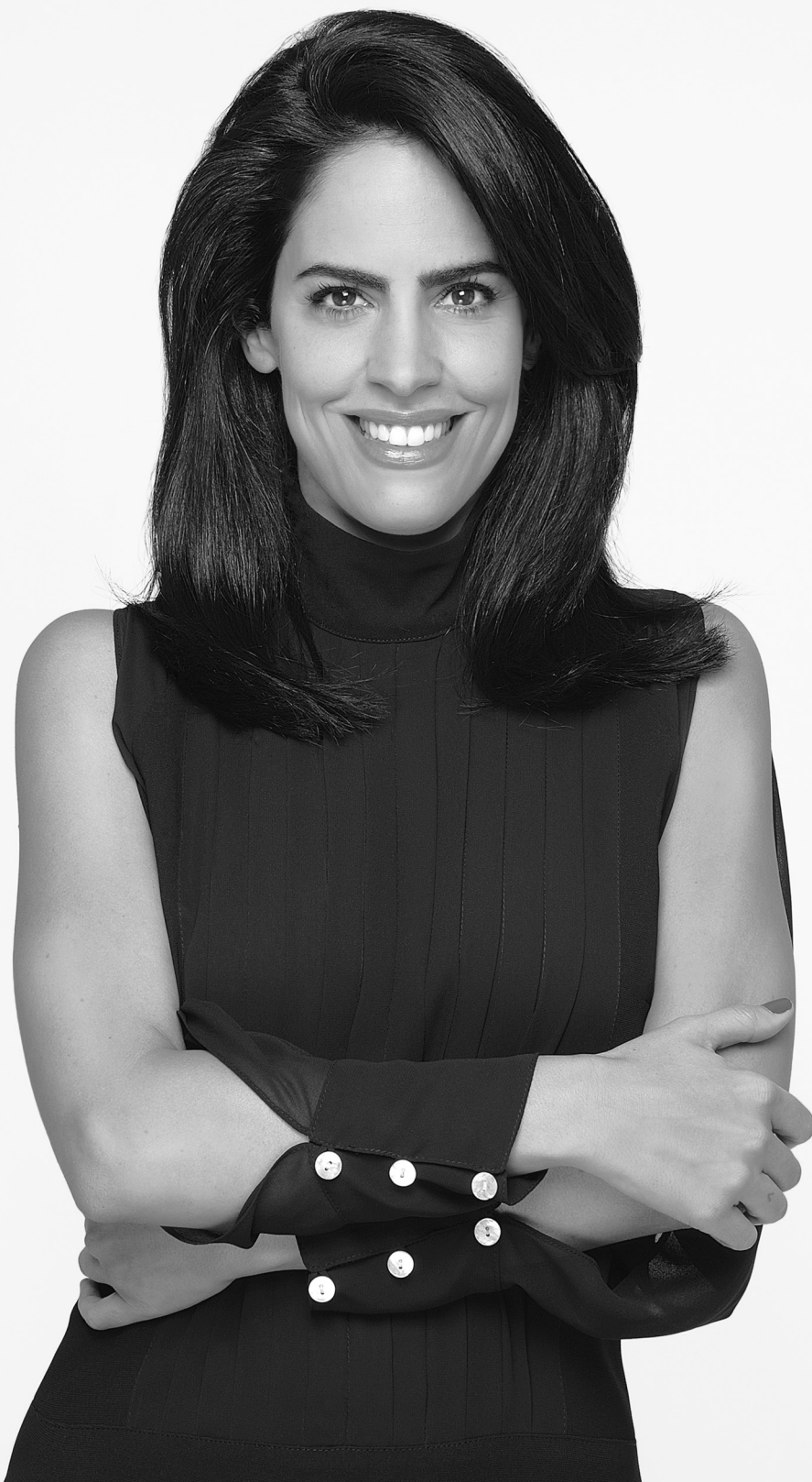
Vestuario: Lorena Saravia